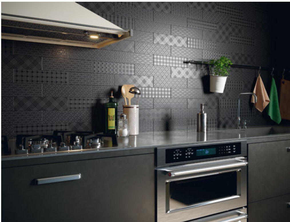
DUO NIGHT MIX 7,5X30