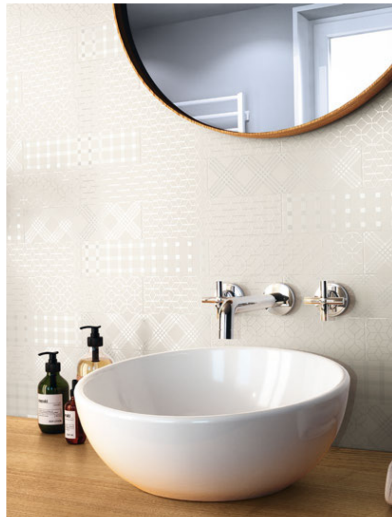
DUO SNOW MIX 7,5X30