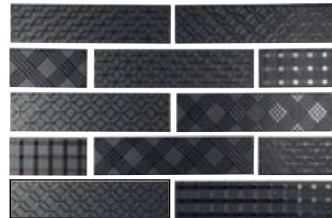
DUO NIGHT MIX 7,5X30 / 3"X12" P76/M