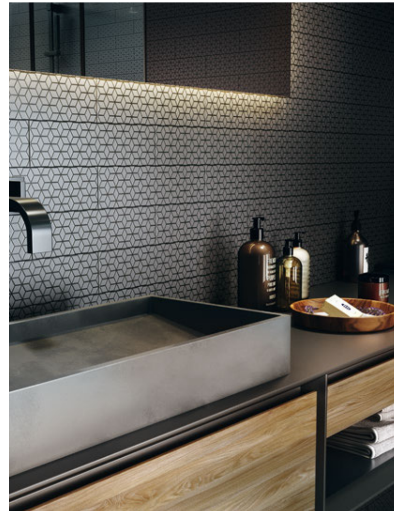
DUO NIGHT MIX 7,5X30