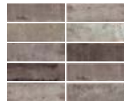
TENNESSEE GREY 5,2X16,1 / 2"X6" N44/M