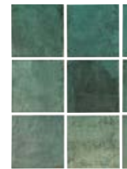
TENNESSEE GREEN 13,8X13,8 / 5,5"X5,5" N41/M