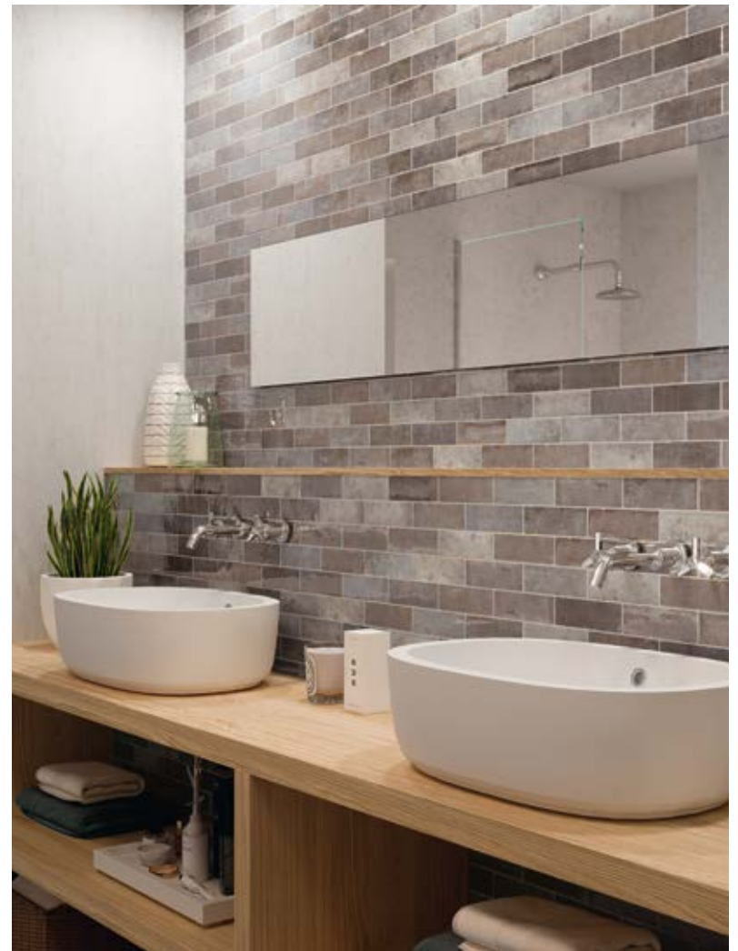
TENNESSEE GREY 5,2X16,1