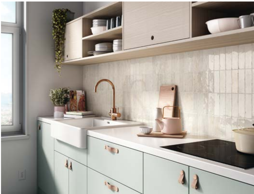
TENNESSEE WHITE 5,2X16,1