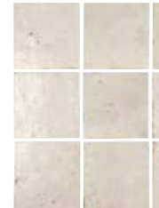
TENNESSEE WHITE 13,8X13,8 / 5,5"X5,5" N41/M