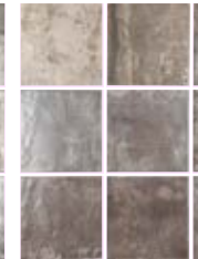
TENNESSEE GREY 13,8X13,8 / 5,5"X5,5" N41/M