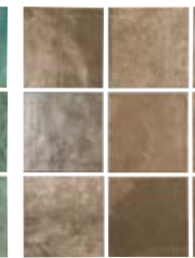
TENNESSEE BROWN 13,8X13,8 / 5,5"X5,5" N41/M