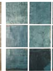
TENNESSEE BLUE 13,8X13,8 / 5,5"X5,5" N41/M