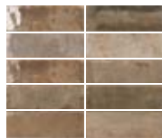
TENNESSEE BROWN 5,2X16,1 / 2"X6" N44/M