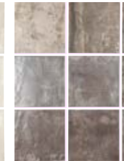
TENNESSEE BLACK 13,8X13,8 / 5,5"X5,5" N41/M