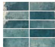
TENNESSEE BLUE 5,2X16,1 / 2"X6" N44/M