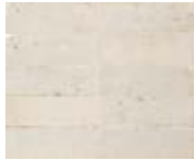
TENNESSEE WHITE 5,2X16,1 / 2"X6" N44/M